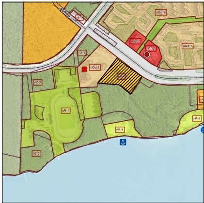
Įtrauka iš Visagino miesto bendrojo plano pagrindinio brėžinio