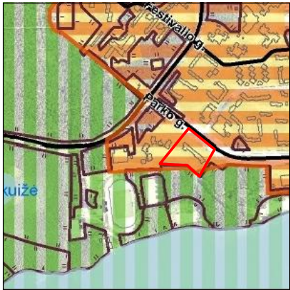
Įtrauka iš Visagino miesto bendrojo plano kraštovaizdžio apsaugos brėžinio